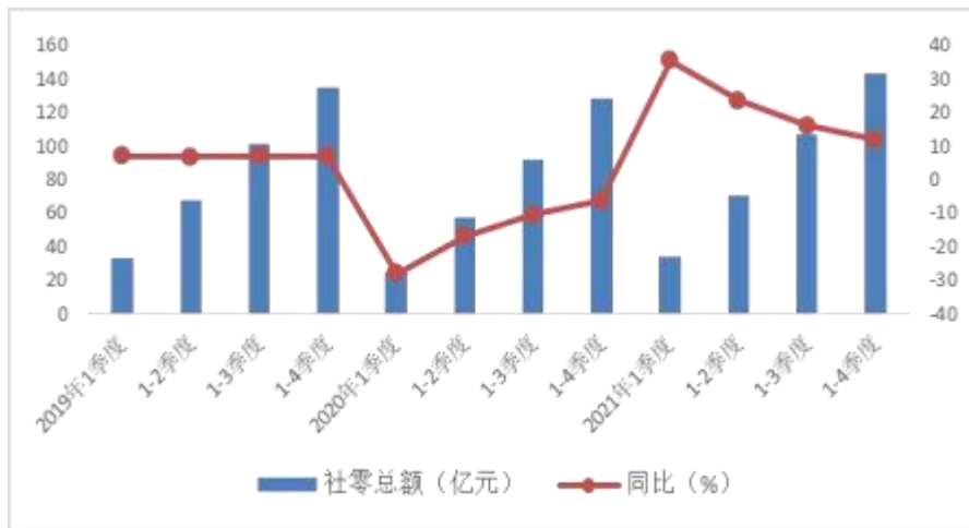
图 6:2019-2021 年社零总额完成情况

受部分限额以上企业下拉影响，商品销售总额指标小幅增长。2021 年，全区实现商品销售总额 318.5 亿元，同比微增 0.6%，其中，限额以上商品销售总额 248.1 亿元，同比下降 4.2%。限额以上批发企业中规模较大的两家公司销售额为 248.1 亿元，占全区商品销售总额的 77.9%，同比下降 4.2%，影响全区商品销售总额下降 3.4 个百分点。若剔除上述两家公司，则限额以上企业销售额为 70.4 亿元，同比增长 21.9%。