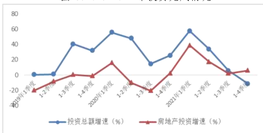
图 5:2019-2021 年投资完成情况

2021 年，全区房地产投资首次突破百亿元，占投资总额的 44%，拉动固定资产总投资增长 2.1 个百分点。其中，住宅类投资 79 亿元，同比增长 18.7%；办公楼类投资 0.8 亿元，同比下降 70.2%；商业用房类投资 4.4 亿元，同比下降 39.1%。受房地产宏观调控及金融政策影响，房地产交易调整下行。全年商品房销售面积 54.5 万平方米，同比下降 6.2%；商品房销售额 116.3 亿元，同比增长 7.7%；房屋新施工面积 457.6 万平方米，同比增长 8.2%，其中，新开工面积 75.9 万平方米，同比下降 59.8%。