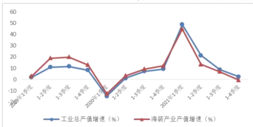
图 2:2019-2021 年累计工业总产值及海装产业产值情况