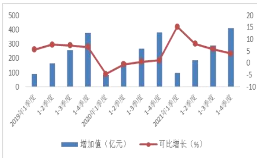
图 1： 2019-2021 年增加值情况

从行业增速看，住宿餐饮业位居首位，可比增长 9.9%；其次是其他服务业 1 可比增长 6.3%（其中，信息传输软件信息技术